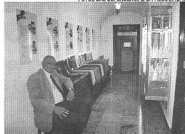
FOTOS DAS DEPENDÊNCIAS DA ASSOCIAÇÃO